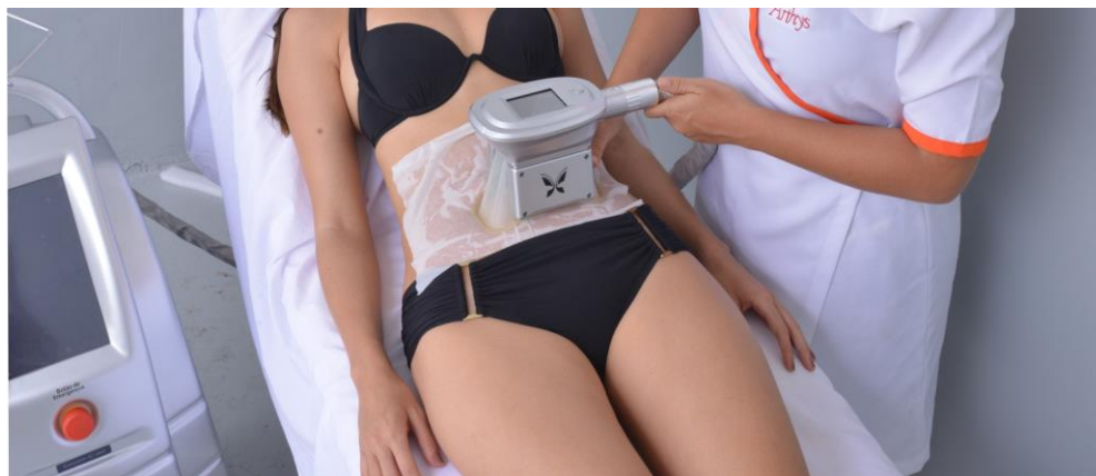
Figura 02: Técnica de aplicação da criolipólise na região abdominal.